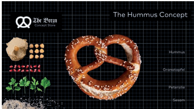
Hippe Zutaten Brezn mit Hummus oder Croissant mit Marshmallows – auf jeden Fall nicht gewöhnlich

Die Münchener Bäckereikette Höflinger Müller (130 Filialen in Bayern) geht mit einer Bayerischen Fast-Food-Kette an den Start: In „The Brezn Concept Store“ wird die Traditionsbackware neu interpretiert. Die Läden wollen mit frischen Brezn in Original Wiesn-Qualität und modernen Belägen den Geschmack der urbanen Kundschaft treffen. „The Hummus Concept“ mit Granatapfelkernen, „The Caprese Concept“, aber auch Klassiker wie das „The Butter Concept“ sind im Angebot. Dazu Avocado, Thunfisch, Spiegelei. Zum Nachtsch gibt es „The Marshmallow Croissant“ mit Lavazza-Kaffee aus Siebträgermaschinen. Im Angebot sind auch warme Speisen wie Breznknödel mit vegetarischer Bratensauce oder mit Schwammerlsauce. Für Knabberfreunde wird das Laugengebäck getrocknet und mariniert: „The Brezn Explosion“. Die Markenkommunikation ist ebenso gar nicht krachledern. „Hea-