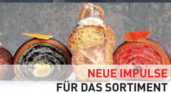
NEUE IMPULSE FÜR DAS SORTIMENT