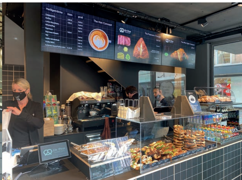
The Brezn Concept Store wurde von der Münchener Kreativagentur The Wunderwaffe entwickelt – vom Sortiment über Ladendesign bis Brezn-Tüte