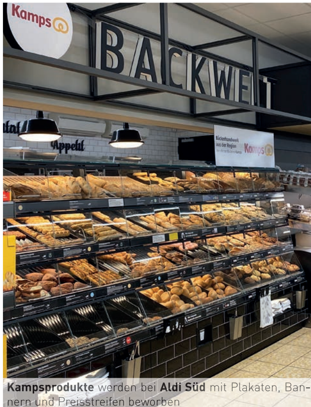
Kampsprodukte werden bei Aldi Süd mit Plakaten, Bannern und Preisstreifen beworben

Seit Anfang März beliefert die Schwalmtaler Bäckerei Kamps (400 Filialen) in einer exklusiven