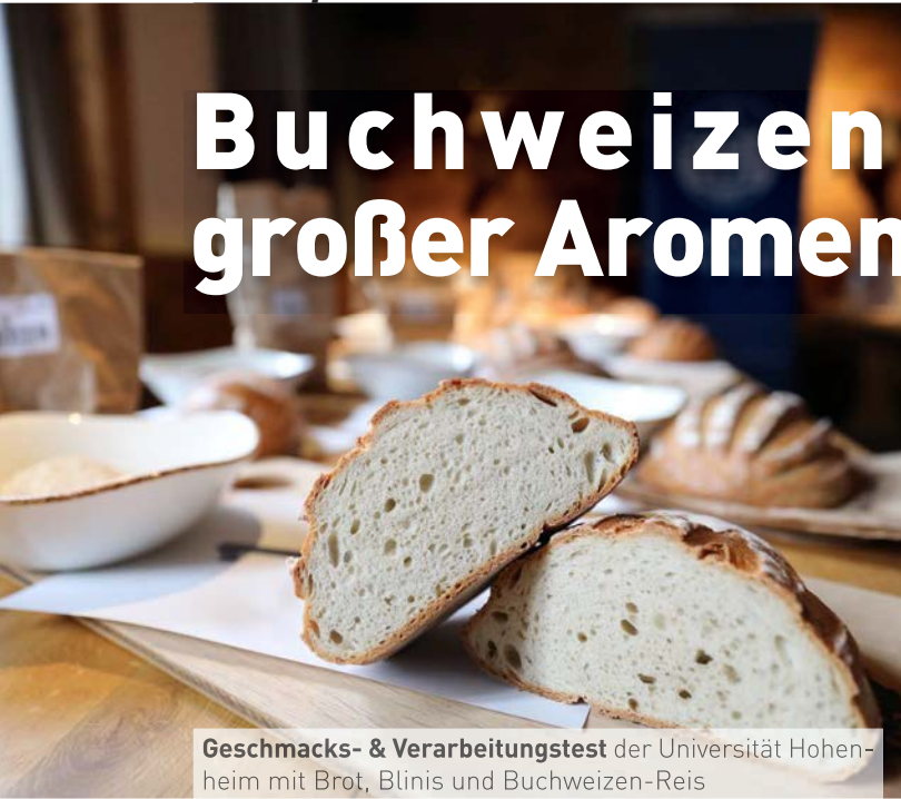
Geschmacks- & Verarbeitungstest der Universität Hohenheim mit Brot, Blinis und Buchweizen-Reis

Back- und Kochtests überraschen alle involvierten Experten: Je nach Zubereitung entwickelt dieselbe Sorte ein komplett anderes Aroma.