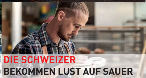
DIE SCHWEIZER BEKOMMEN LUST AUF SAUER