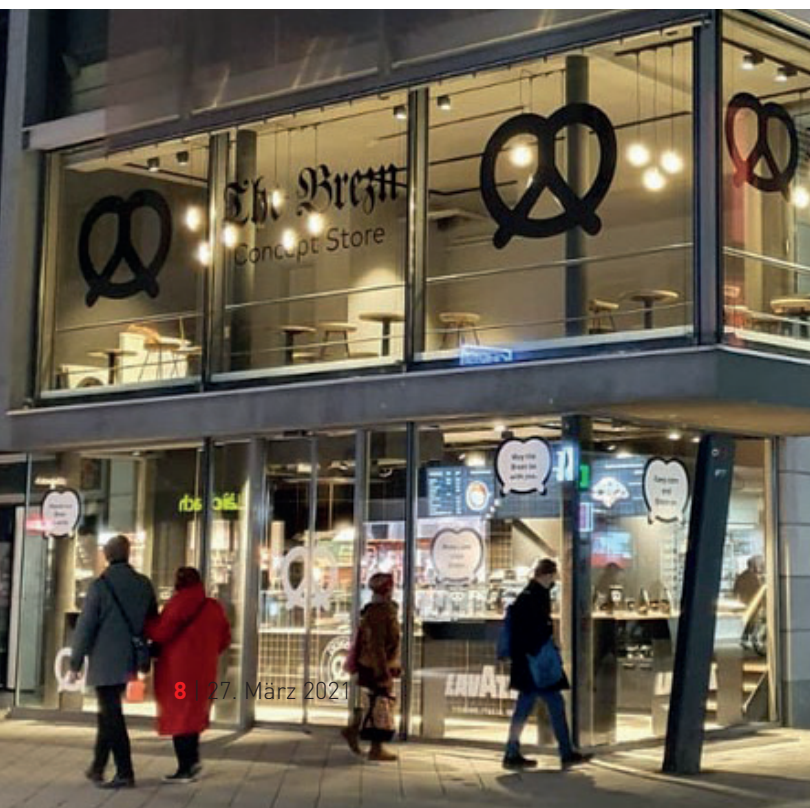
8 | 27. März 2021

Unternehmen, die in fortschrittliche Produktions- oder Recyclingtechnologien investieren wollen, profitieren von einem neuen Corona-Sonderprogramm. Das Land Nordrhein-Westfalen